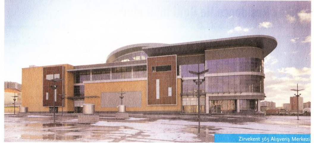
Zirvekent 365 Alışveriş Merkezi

Ana yaklaşım yönünde yer alan köşe restoran ve yeme içme alanı gibi fonksiyonlarla dışa dönük ve şeffaf şekilde tasarlanan yapı kütesinde; iç ve dış mekan arasında ile görsel ilişki sağlanması hedefleniyor. Yapının diğer bölümlerinde ise, iç mekan kalitesi gözetilerek içe dönük bir tasarım gerçekleştiriliyor. Girişlerin algılanması ve kolay erişilir bir bina yaratılması hedefiyle, cephe girişleri tanımlayan saçaklar ve farklı malzemeler kullanılıyor. Kil panel ve ahşap gibi sıcak malzemeler kullanılarak yeşil içerisinde keyifli ve